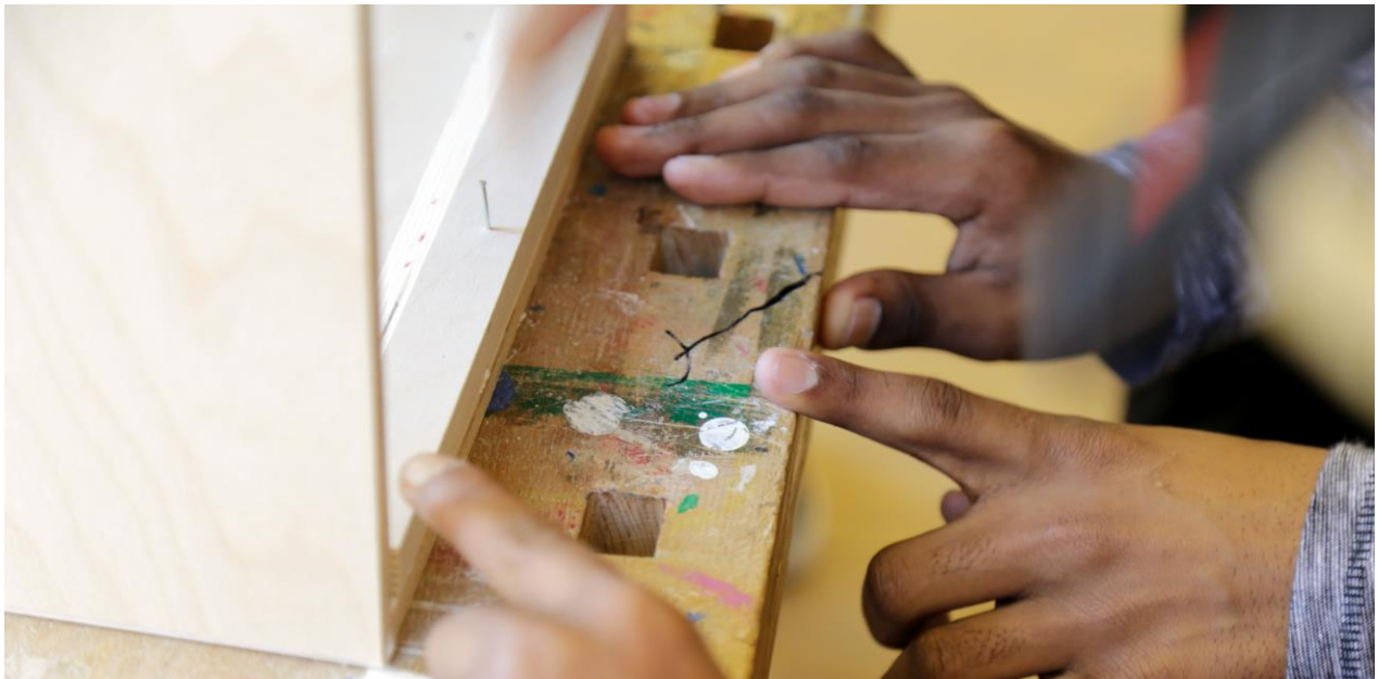
Gemeinsames Arbeiten beim Bau einer Cajon

Vor allem bietet es sich an, damit das Erzählen von Geschichte zu gestalten und zu dramatisieren, etwa in Form von „Klanggeschichten“.