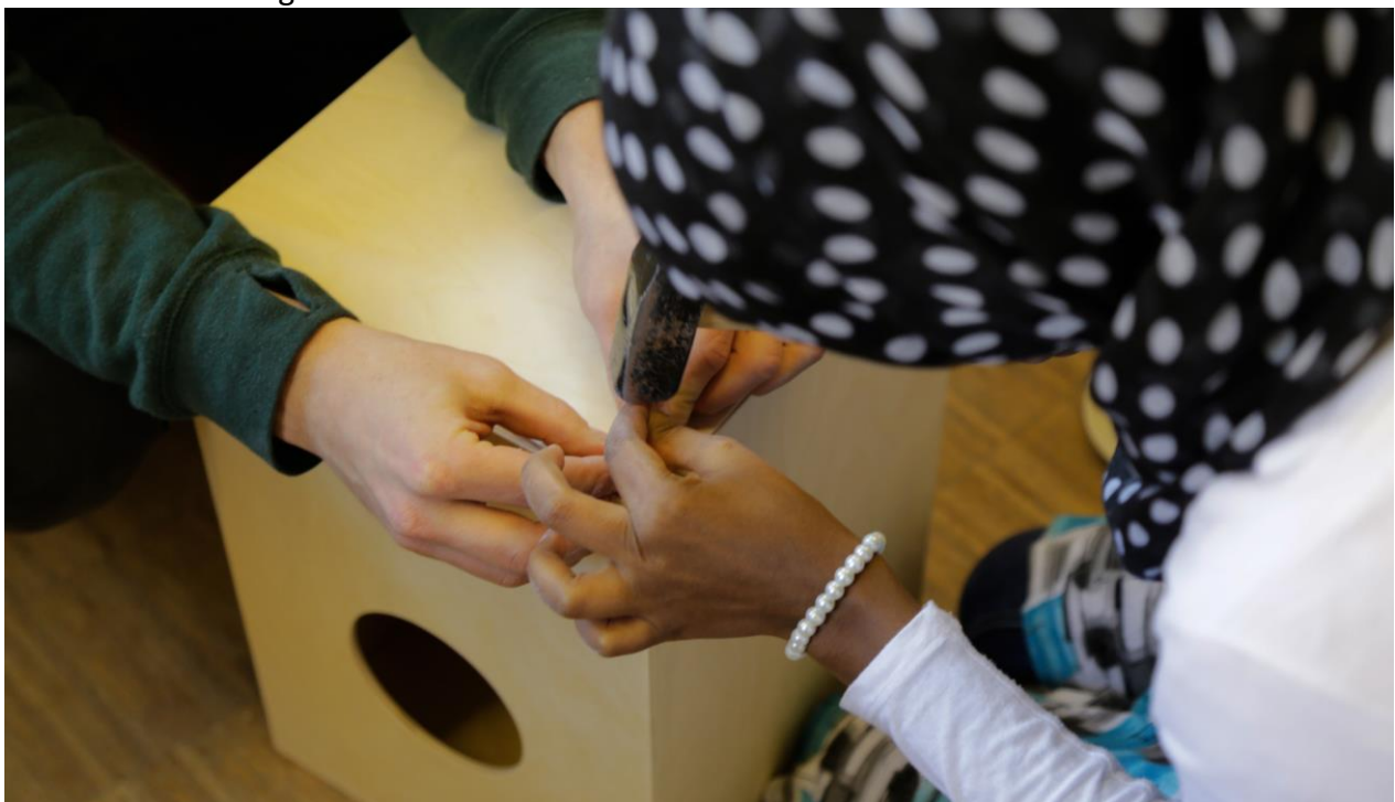
Bau einer Cajon

Die Videodokumentation der Workshops wird noch mit dem Jugendamt abgestimmt. Dabei gilt es die Frage zu klären, was und auf welche das Material für eine Veröffentlichung verwendet werden kann oder den Vorgaben entsprechend auszuwählen ist. Die Jugendliche sollen bei einem weiteren Workshop in die Erarbeitung des Dokumentationsfilms eingebunden werden. Bei Erstellung des Sachberichts war der Abstimmungsprozess mit den Verantwortlichen des Jugendamts noch nicht abgeschlossen.